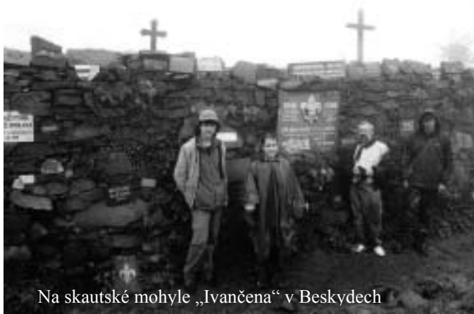
Na skautské mohyle „Ivančena“ v Beskydech

Druhý den je neděle. Chceme navštívit mši svatou v Borové. Jemně prší a domácí a sousedé nás i přes naše odmítání odvězejí auty do místního kostela. Právě dnes se zde slaví první