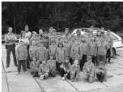
To jsme frajeři, co?