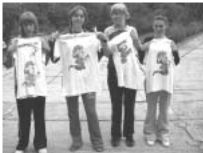
...opět tradice, jen obrázek je jiný...